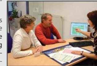
Die Gonze & Schüttler AG wurde bereits im Jahre 1994 nach ISO 9001 zertifiziert

Wir verarbeiten und fixieren das täglich neu dazu gewonnene Know-how in kanzeleispezifische Regeln zur Qualitätssicherung und Steigerung des Leistungsniveaus. Dies zum Nutzen unserer Mandanten und zur Differenzierung vom Wettbewerb.